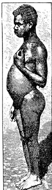
PYGMÉE provenant du livre Peuples et Races , de Deniker.

On remarquera la similitude des attitudes de ces deux sujets, tant au point de vue facial qu'abdominal et des membres inférieurs. Leur différence est dans le cou et provient de leur taille. Le myxœdémateux n'a que 0 m. 98, en raison d'une absence presque complète de la thyroïde ayant entraîné une déficience considérable des autres glandes. Le Pygmée mesure environ 1 m. 40, car son hypofonction thyroïdienne a été en partie compensée par le fonctionnement de ses autres glandes.