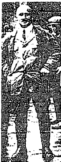
Julius Streicher : un combattant courageux et martyr de la Vérité

Julius Streicher est l'écrivain et l'autorité sur le problème juif la plus connue dans toute l'histoire. Il a été grandement diffamé par les associations juives organisées. Des onze martyrs qui moururent sur les potences à Nuremberg le 16 Octobre 1946, seul Streicher mourut uniquement pour ses discours et ses écrits.