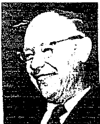
Le sénateur américain Robert Taft

Le sénateur républicain de l'Ohio, Robert Taft, s'éleva contre la parodie de justice que constituaient les procès de Nuremberg pour crimes de guerre avec ces paroles prophétiques : « C'est une erreur judiciaire que le peuple américain regrettera longtemps » . R. Taft savait que les précédents établis à Nuremberg seraient utilisés contre les Américains dans un conflit futur contre les Rouges. En Corée et au Vietnam, des Américains furent jugés pour « crimes de guerre » par des « tribunaux populaires » communistes.