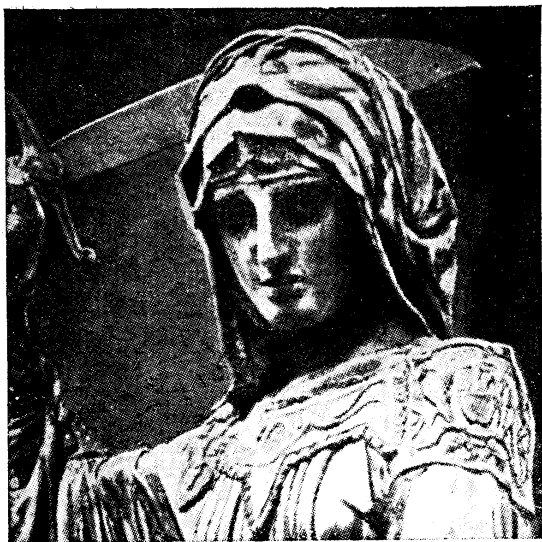
Donatello: Kopf der Judith

Goethes Klärchen (im „Egmont“) ist auch nicht historisch, spiegelt aber die Regungen der Seele eines deutschen Mädchens durchaus richtig wider und kann als Beleg für den Charakter der deutschen Frauenseele gelten. Wichtig ist nicht, was eine historisch nachweisbare Jüdin getan hat, sondern wichtig ist, was eine Jüdin charaktermäßig, aus ihrem Blute heraus, tun kann und unter bestimmten Umständen immer wieder tun wird.