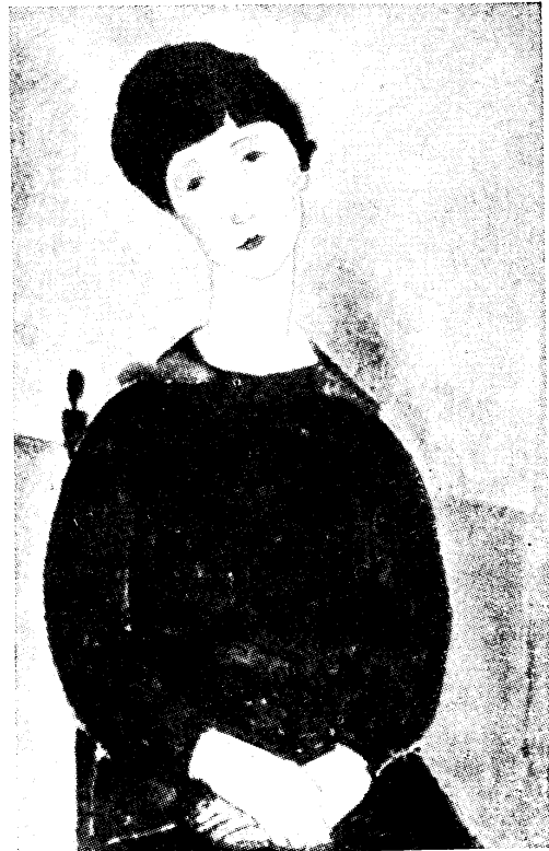
Marc Chagall und Amedeo Modigliani: Frauenbildnisse jüdischer Maler

Und bei Goethe ist die Frau maßgebend für die Ethik des menschlichen Zusammenlebens; in „Torquato Tasso“ läßt er die Prinzessin sagen: