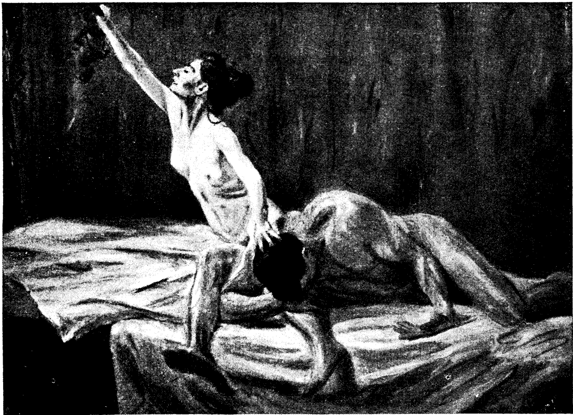
Prof. Max Liebermann: Simson und Delila