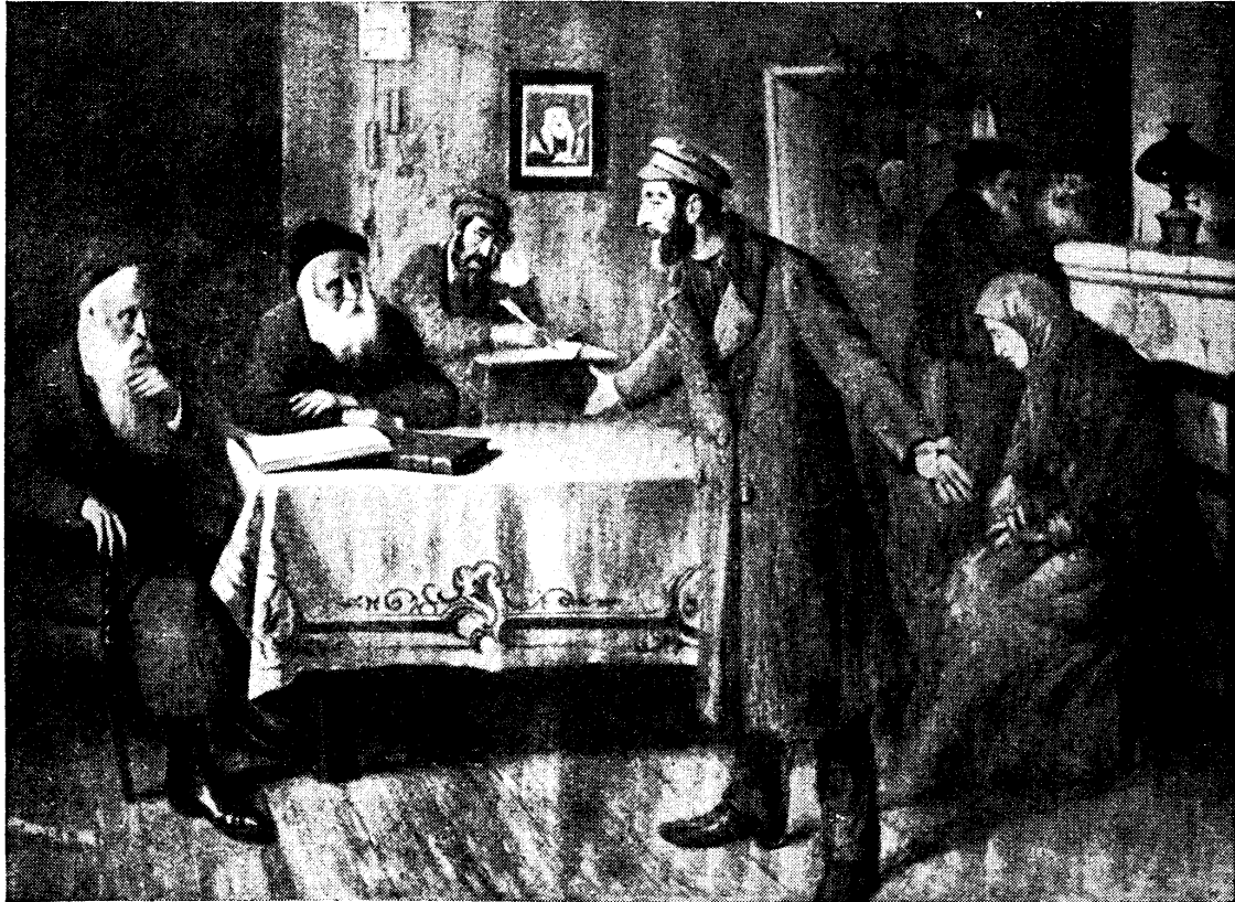
Die Scheidung Gemälde des jüdischen Malers J. Pän

gegangene Notzucht bedeutete! Was die Rechte der Frau anbelangt, so durfte sie vom Mann nur Nahrung, Kleidung und, wie Luther sich ausdrückt, Eheschuld (Weischlaf) verlangen (nachzulesen im 2. Buch Mose). Um leichtfertige, egoistische Scheidungsmotive ein wenig zurückzudämmen, verpflichtete die spätere Gesetzgebung den Mann zur Auszahlung der im Ehekontrakt vereinbarten „Kettuba“ mitgift und Beihilfe für Todes- und Scheidungsfall. Nach Abschluß des Talmuds wurde, um rechtlichen Folgen eines leichtfertig oder formell ungenügend durchgeführten Scheidungsaktes vorzubeugen, die Durchführung des Scheidungsaktes in den Beth-din (rabbinisches Gerichts-