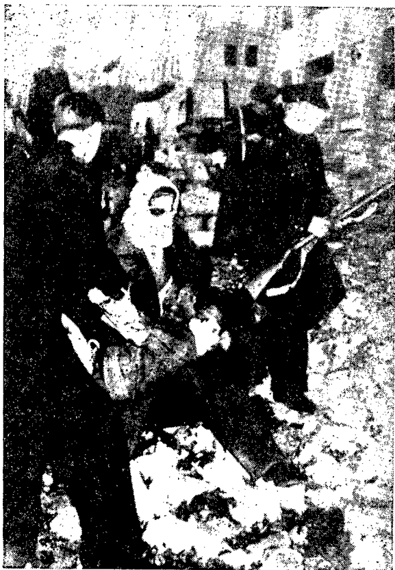
Policías y soldados británicos (1948: antes de la evacuación) auxilian a las víctimas civiles de los terroristas judíos.

12 de abril: El Palmach ataca la aldea de Kolonia, matando a 14 personas en sus casas (Levin, Harry, "Batalla por Jerusa-