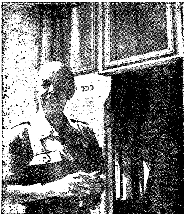
Bernadotte, Mediator de la ONU en Palestina, a las puertas de su sede en Haifa, días antes de ser asesinado —el 17 de Septiembre de 1948— por terroristas de la organización sionista STERN.

a 10 árabes en un café en Jaffa, hacen volar el ferrocarril Jaffa-Tel-Aviv (The New York Times, 2 de enero de 1948); terroristas sionistas atacan la aldea de Balad as Sheikh, matando a 17 personas, hiriendo a 33 hombres, mujeres y niños (Keesing, obra citada, p. 9237).