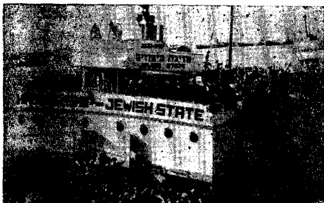
Enero, Febrero y Marzo de 1948. Contingentes de la organización terrorista Haganá desembarcan para dar comienzo a su campaña de intimidación y exterminio.

3 de marzo. La Stern hace estallar un edificio de departa-