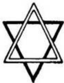
Deuxième Logos Macrocosme