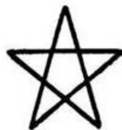
Troisième Logos Microcosme

Et les a résumés dans ce chiffre : 7-7-7, ou chiffre ésotérique des trois Logos. Leur chiffre exotérique est la multiplication successive de ces trois septénaires évolutifs, soit 313.