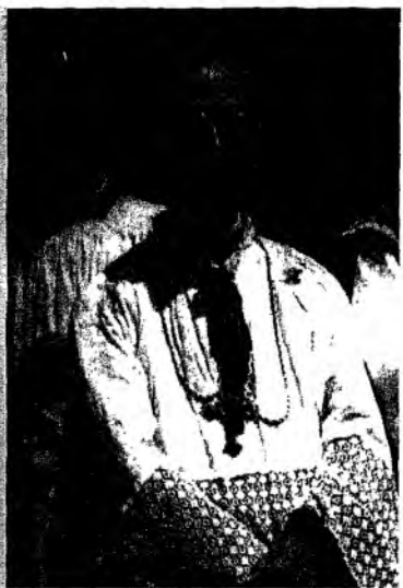
Obispo Castro Mayer