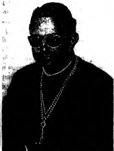
Arzobispo Proença Sigaud